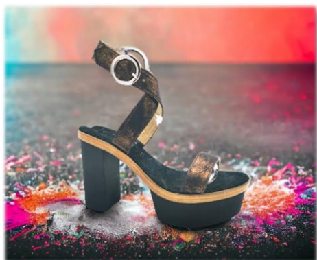
BRIDE A BOUCLE

Du 35 au 42 Argento, bronzo, bluette, fuxia ou oro