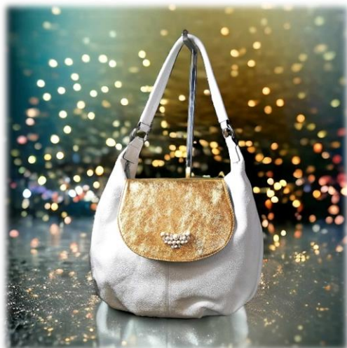
Oro à pression