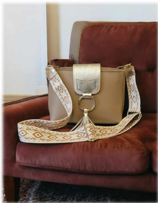
Médium Sofia moka + rabat Félicia platino + bandoulière Design oro