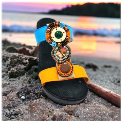
Passante Ethnic bronze/orange