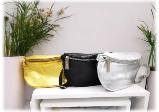
Banane Oro, Nero et Argento