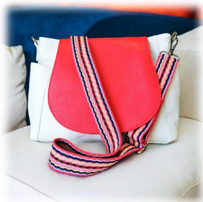
Rabat Filosofia corallo et bandoulière Bohême corail