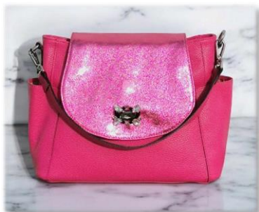
LAMINATA A PRESSION

Cuir métalisé salvia, tuchese, orchidea, oro ou rosa