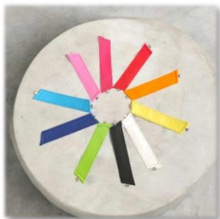
AVANT SANS PRESSION