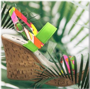
BRIDE CONFORT FLUO