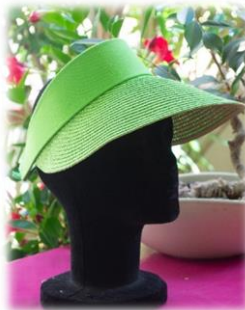
Verde - 30 -