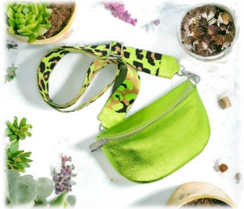
Mela + bandoulière Design Mela (vendue séparément)

Cuir lamitata argento, nero, rosa, tuchese, oro ou mela avec bandoulière cuir assortie