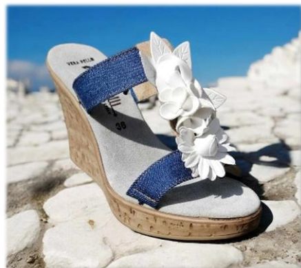
Passante fleurie blanche