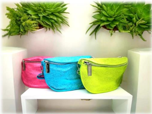
Banane Rosa, Tuchese et Mela