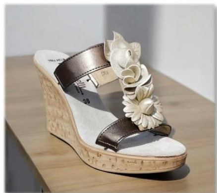
Passante fleurie dorée