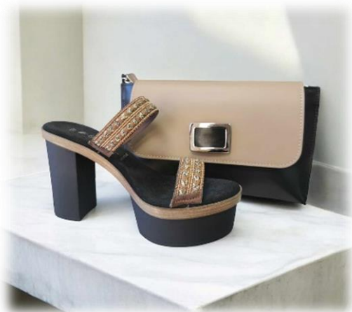
Cannella avec Baby Sofia nero et rabat à pression moka