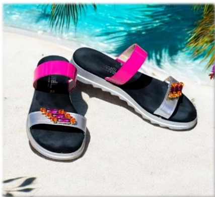
STEP 32€ LA PAIRE