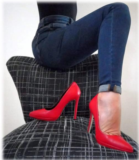
Las Vegas rouge

Cuir noir ou rouge Talon 10 cm, du 36 au 41