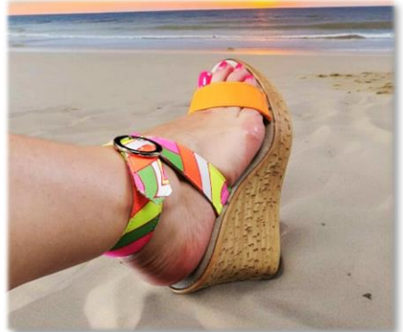
BRIDE A BOUCLE FLUO