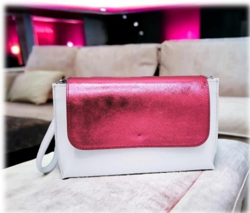
Rabat Laminata rosa