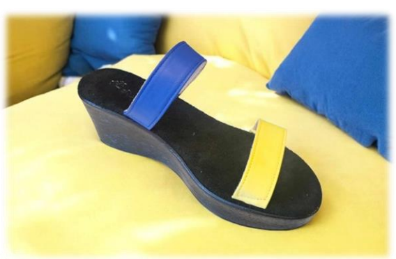
Cobalt arrière Et Limone avant