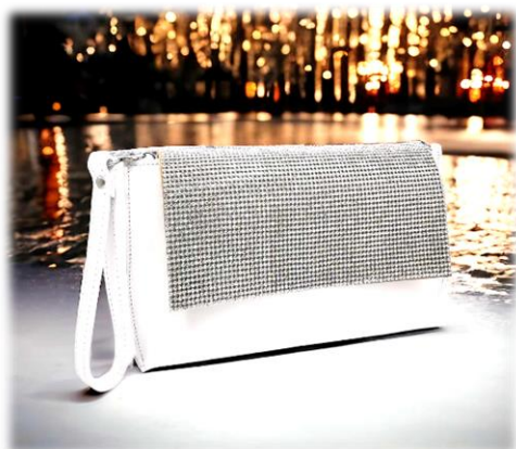
Baby Sofia bianco + rabat strass