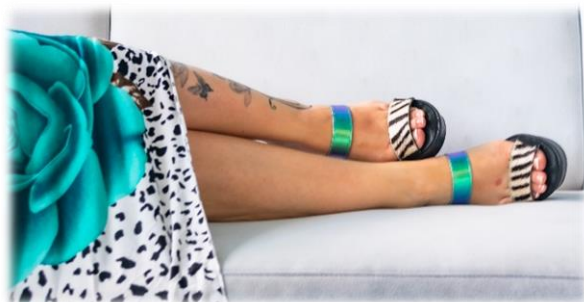
Avant Cavallino zèbre et arrière Océan