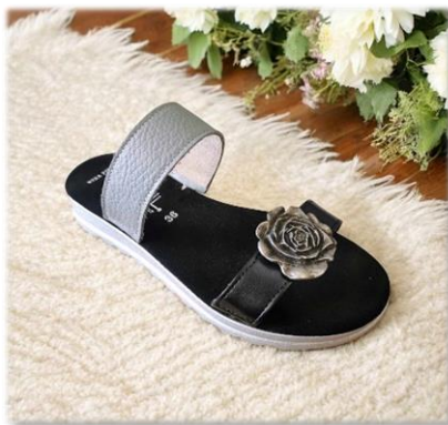
FIORE METAL 18€ LA PAIRE