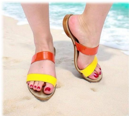
Avant sun et arrière orange