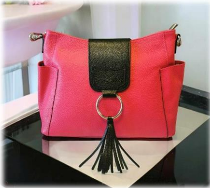
Fuxia avec rabat Félicia nero