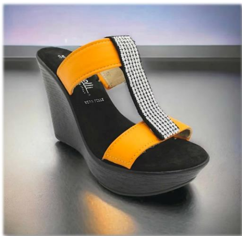
Passante strass sur nubuck noir