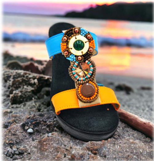
Carota et Tuchese