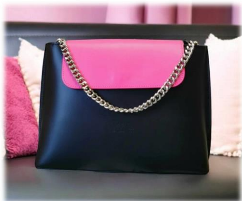
Big Sofia nero + rabat sans pression

Cuir nero, bianco ou moka Avec poignée en cuir 26 x 16 cm