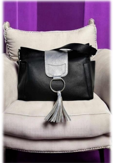
Félicia nero et rabat argento