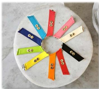
AVANT A PRESSION