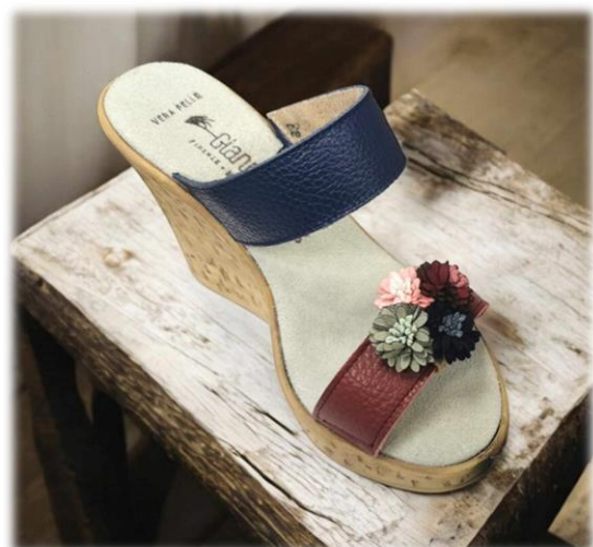
Marine et Bordeaux