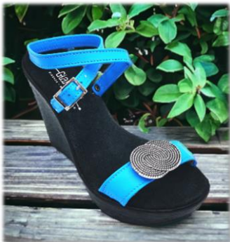
LACET A BOUCLE