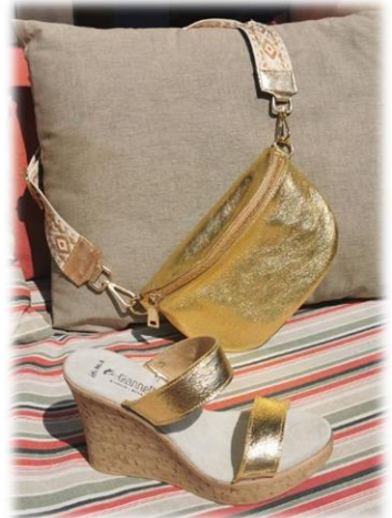
Oro + bandoulière Design oro