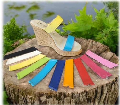
Couleurs cuir Sauvage