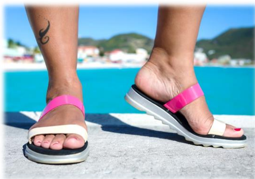
Avant sabbia et arrière dolly