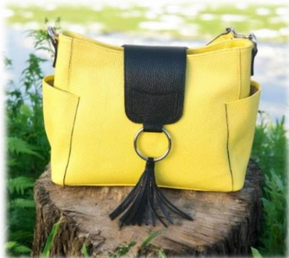
Félicia Citrone rabat Félicia nero