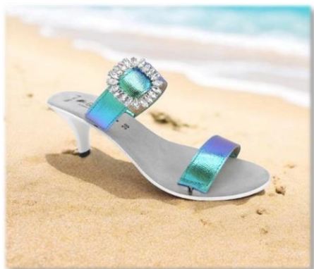
FIBBIE CRISTAL 16€ LA PAIRE