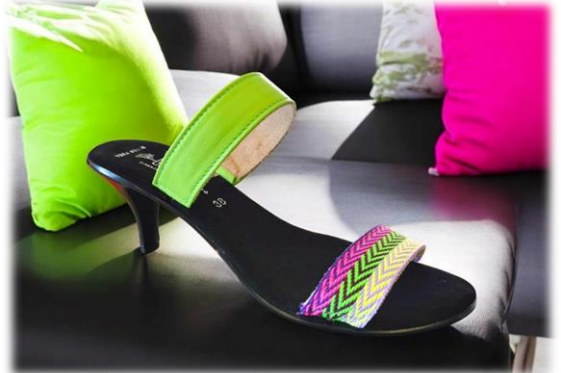
Avant Viva et arrière cuir Sauvage Acido