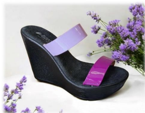
Avant tropéa et arrière lilla