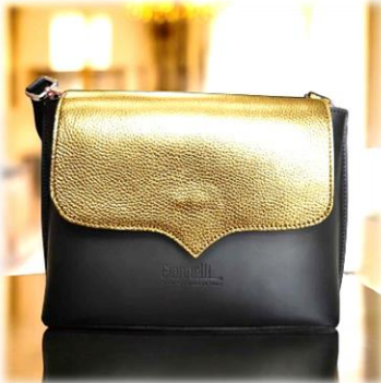
Platino sur Sofia Médium