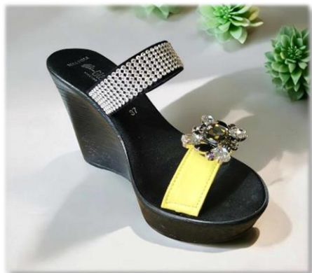
LUXURY 38€ LA PAIRE Noir/cristal