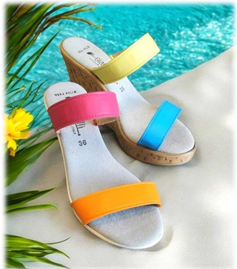
Fuxia, carota, limone et tuchese