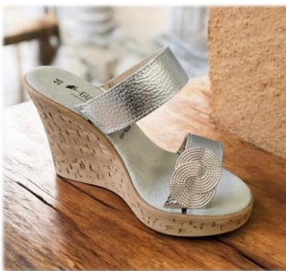
SPIRALE 16 € LA PAIRE