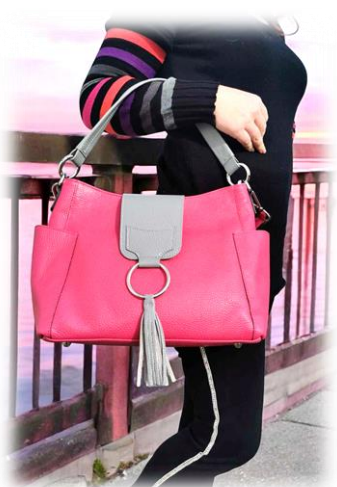
Anse Philo Grigio

Dans toutes les couleurs cuir martelé (p52) 42 cm