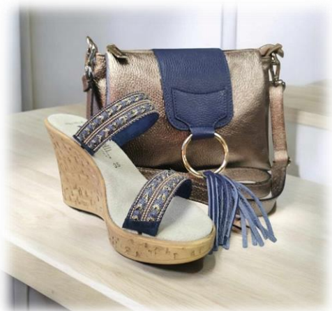
Gallone blu avec sac Joëlle bronzo