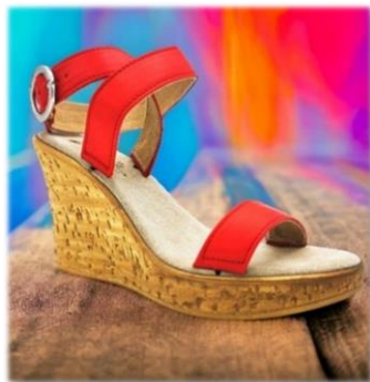
BRIDE A BOUCLE