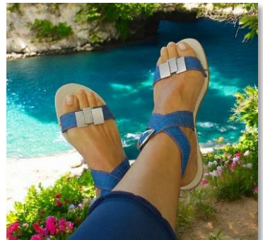
BRIDE A BOUCLE