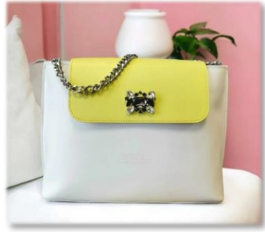
RABAT A PRESSION