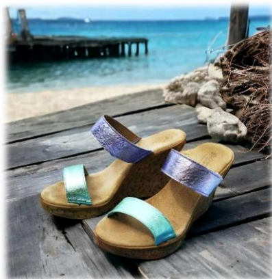
Orchidea et Salvia